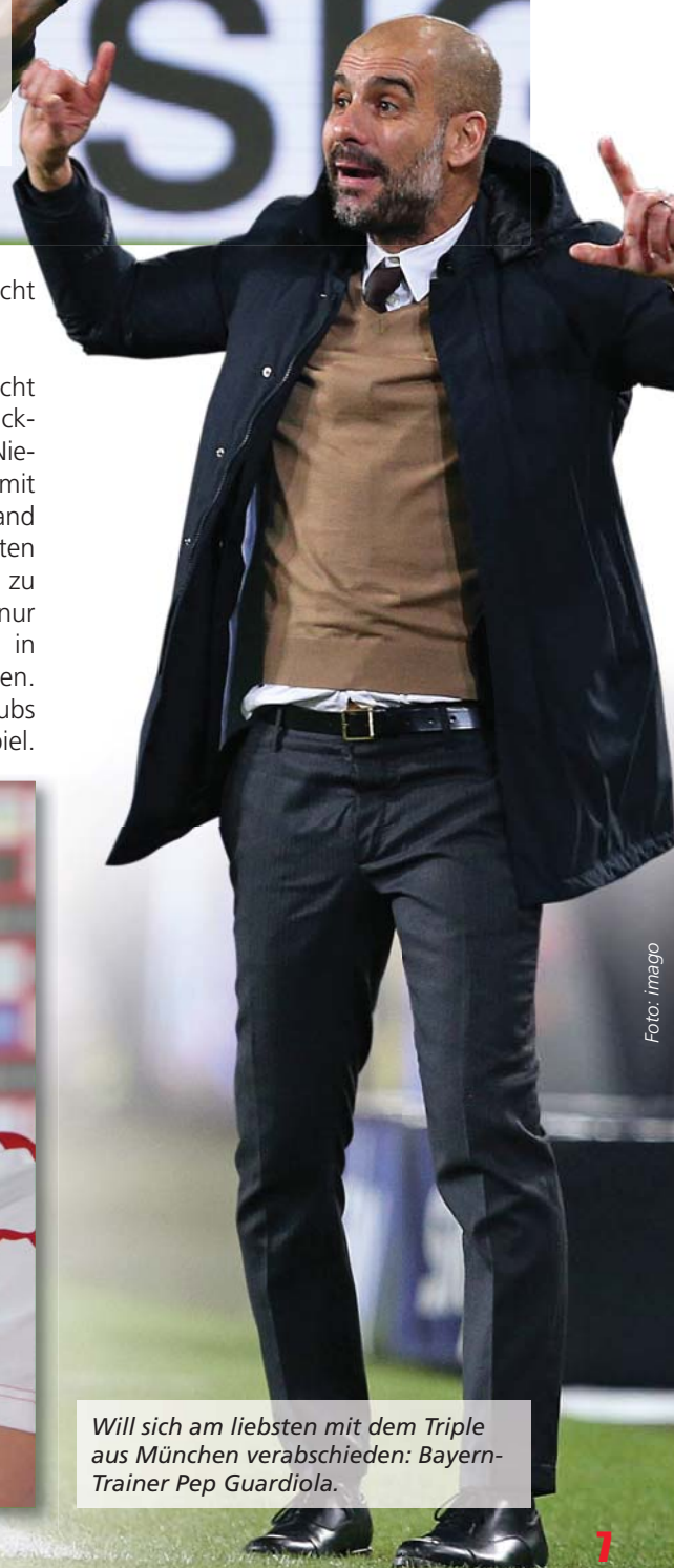
Will sich am liebsten mit dem Triple aus München verabschieden: Bayern-Trainer Pep Guardiola.