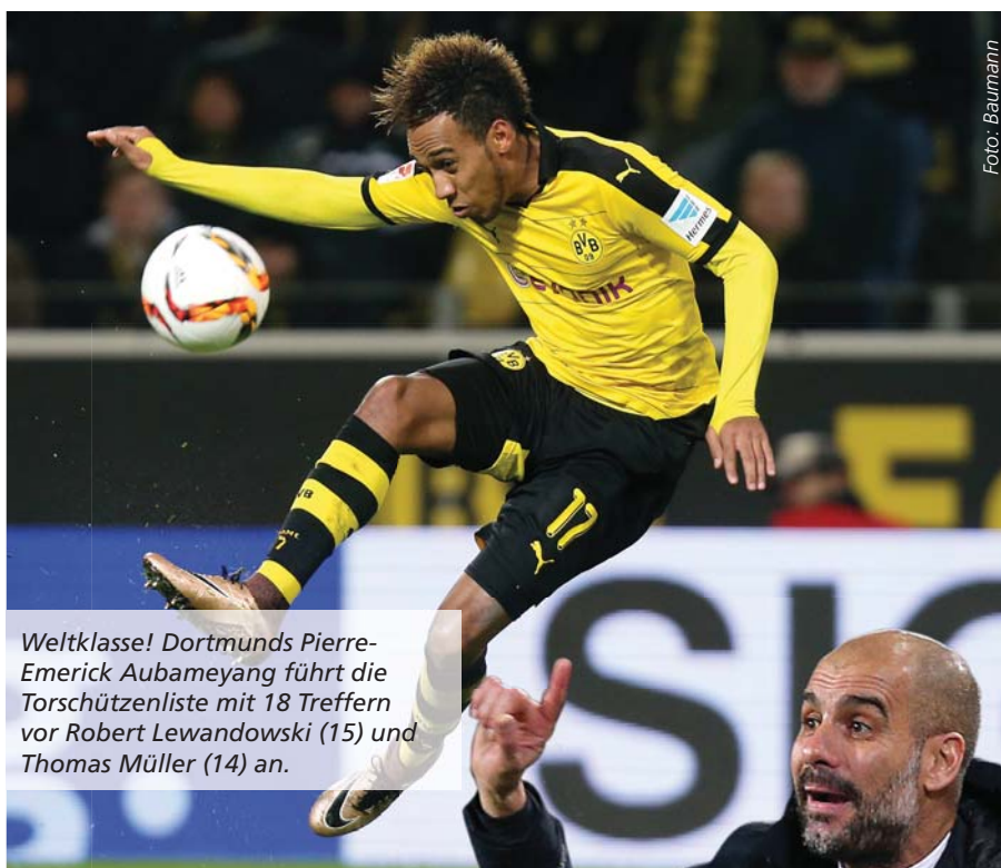
Weltklasse! Dortmunds Pierre-Emerick Aubameyang führt die Torschützenliste mit 18 Treffern vor Robert Lewandowski (15) und Thomas Müller (14) an.

Sorgenvolle Mienen auch in Hessen: Aufsteiger Darmstadt 98 gewann sein letztes Spiel an Nikolaus – der einzige Erfolg aus den vergangenen acht Pflichtspielen. Ähnlich geknickt wie die „Lilien“, die aktuell auf Tabellenplatz 13 stehen (18 Punkte), kommt die Frankfurter Eintracht daher. 17 Punkte, Tabellenplatz 14. Kann Trainer Armin Veh den Schalter umlegen? Auch die Frankfurter