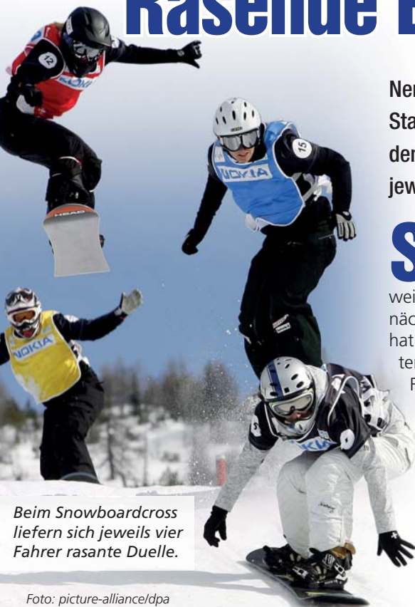
Beim Snowboardcross liefern sich jeweils vier Fahrer rasante Duelle.