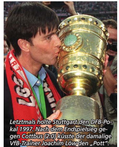
Letztmals holte Stuttgart den DFB-Pokal 1997. Nach dem Endspielsieg gegen Cottbus (2:0) küsste der damalige VfB-Trainer Joachim Löw den „Pott“.

Das Pokal-Viertelfinale am Faschingsdienstag (9.2.): Leverkusen gegen Bremen (19 Uhr), dann Stuttgart gegen Dortmund (20:30 Uhr, live, ARD). Tags darauf sind die Favoriten schnell gemacht: Die Profis von Hertha BSC wollen nach 37-jähriger Abstinenz endlich mal wieder ins Endspiel im eigenen „Wohnzimmer“. Soll der Traum nicht platzen,