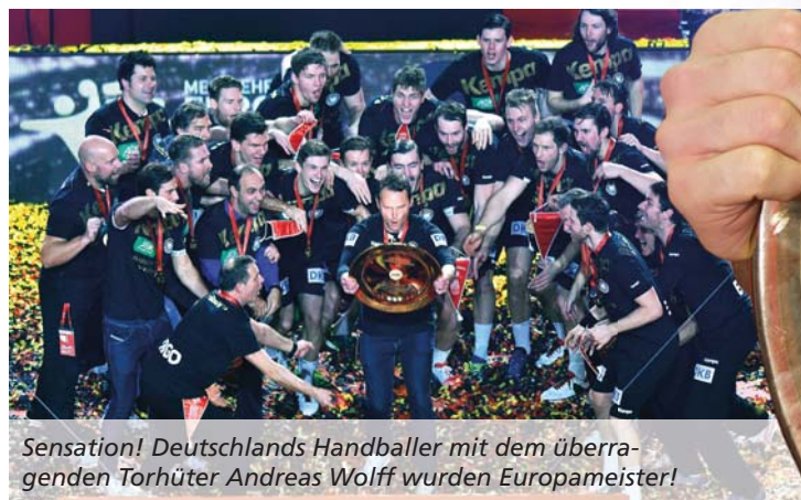
Sensation! Deutschlands Handballer mit dem überraschenden Torhüter Andreas Wolff wurden Europameister!

Keksfabrik das „Kex“, ein Hostel. Ganz im Gegensatz zu dem brüchigen Gebäck hatte er mit Deutschlands Abwehr im Endspiel Beton angerührt, an dem die spanischen Angriffe meist abprallten. Doppelter Lohn: Mit dem EM-Titel gewannen Deutschlands Handball-Helden auch das Ticket für die Olympischen Spiele. Rio, wir kommen!