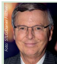
Wolfgang Bosbach Politiker, Rechtsanwalt, Fan vom 1. FC Köln, tipp:

Form: s/S = Sieg, u/U = Unentschieden, n/N = Niederlage, kleine Buchstaben = Heimspiel, große Buchstaben = Auswärtspiel, (F) = Frauen. Wertung nach der regulären Spielzeit (Verlängerungen werden nicht berücksichtigt). Zahlen in Klammern = Tabellenstand.