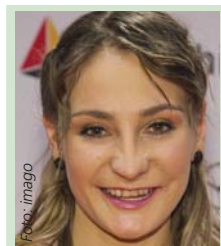
Kristina Vogel 2 x Olympiasiegerin im Bahnradsfahren, Bayern-Fan, tippt:

* = remisverdächtig ** = stark remisverdächtig *** = Die Spiele 35 und 42 wurden verlegt. Für diese Spiele gilt daher das Ergebnis der Ersatzauslösung.