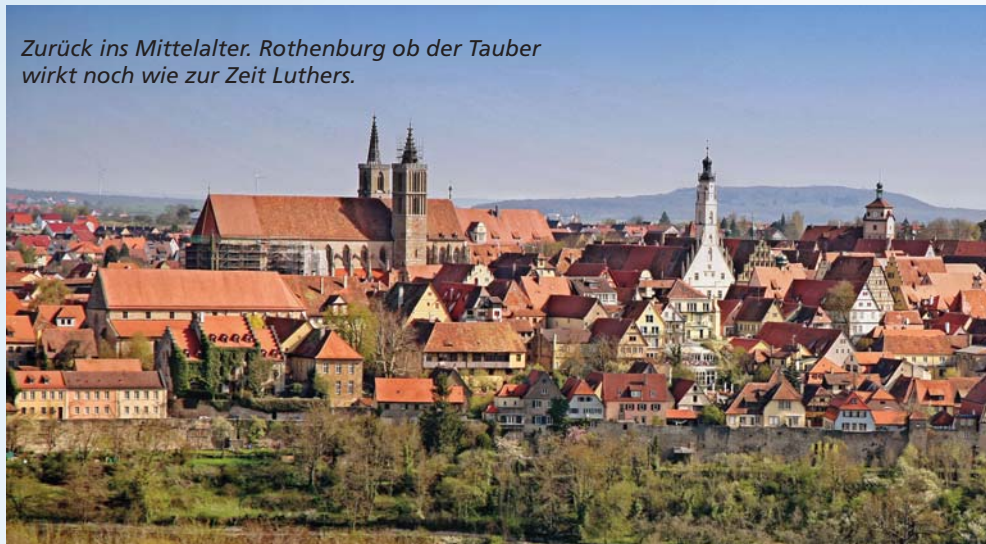
Zurück ins Mittelalter. Rothenburg ob der Tauber wirkt noch wie zur Zeit Luthers.