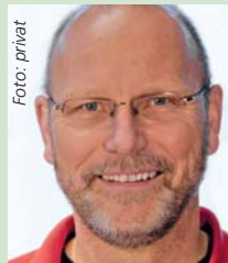
Hartmut Binder Pressebüro Binder Nürtingen, Fan der TG Nürtingen, tippt: