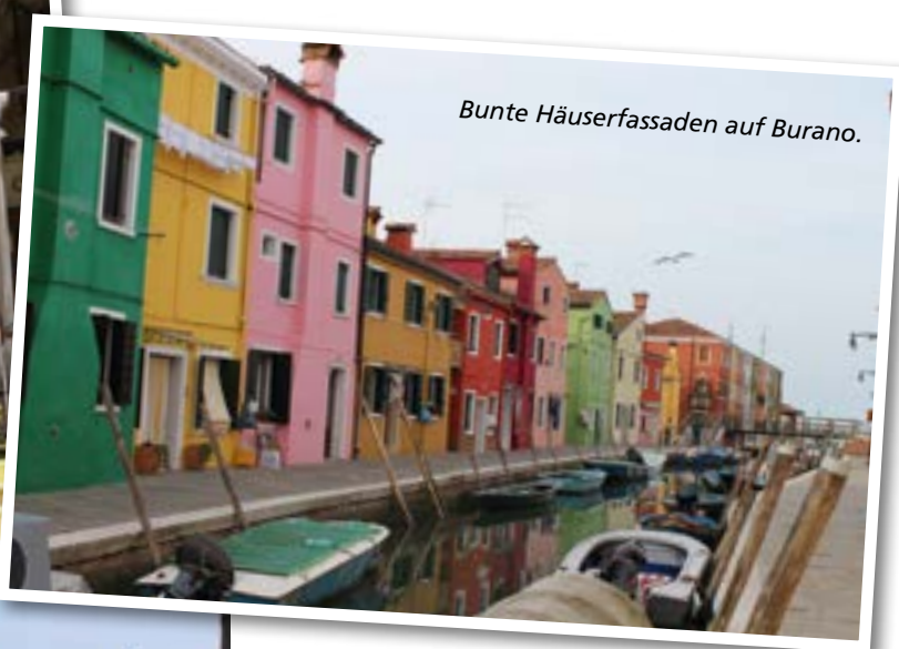
Bunte Häuserfassaden auf Burano.