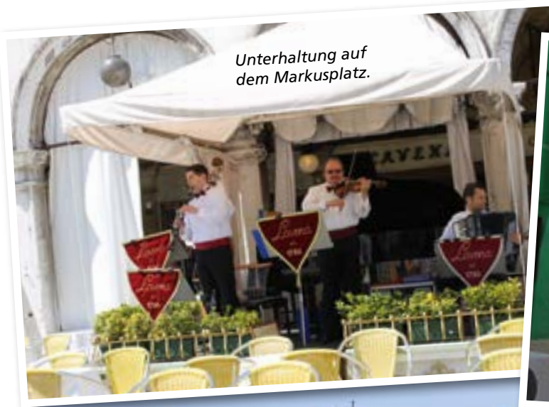
Unterhaltung auf dem Markusplatz.