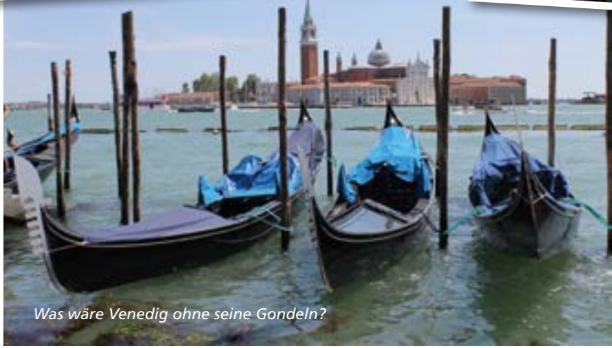
Was wäre Venedig ohne seine Gondeln?

fast stehen zu bleiben scheint. Dann folgt der Lido, Venedigs Seebad. Noch ist wenig Bootsverkehr, doch weiter nördlich beginnt der Trubel.