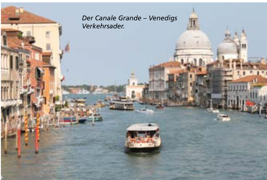
Der Canale Grande – Venedigs Verkehrsader.

Der Skipper steuert sein Schiffchen gemächlich an der langgezogenen, schmalen Insel Pellestrina entlang. Die Fensterläden der Häuser sind geschlossen. Ein Fischer stapft auf der Backbordseite durchs flache Wasser. Muscheln sucht er, fürs Abendessen oder für den Markt. Die Sonne flimmert, während die Zeit