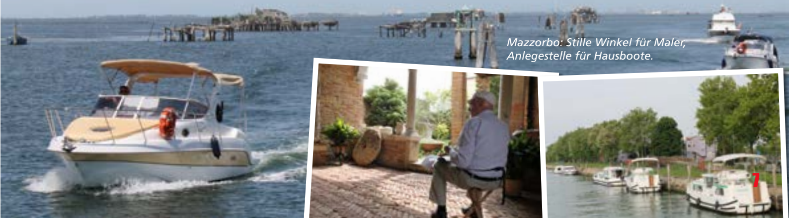
Mazzorbo: Stille Winkel für Maler, Anlegestelle für Hausboote.

Anbieter: www.khp-yachtcharter.com oder www.charterwelt.de