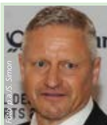
Stefan Blöcher 259-facher Hockey-Nationalspieler, Olympia-Silber 1984 & 1988, tippt:

grün = Gewinnspiele 6aus45 Auswahltipp, * = Zusatzspiel, E = Ersatzauslösung