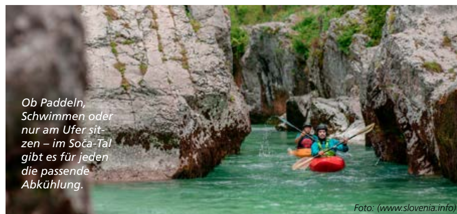
Ob Paddeln, Schwimmen oder nur am Ufer sitzen – im Soča-Tal gibt es für jeden die passende Abkühlung.