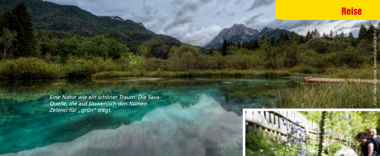
Eine Natur wie ein schöner Traum: Die Sava-Quelle, die auf Slowenisch den Namen Zelenci für „grün“ trägt.