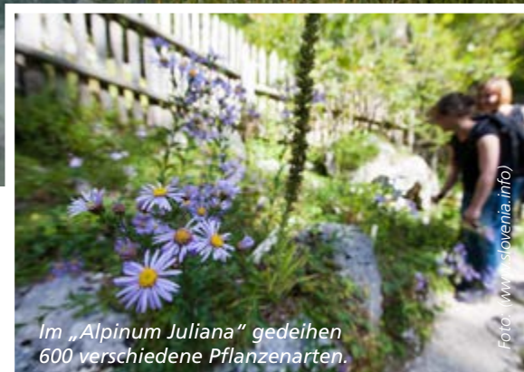
Im „Alpinum Juliana“ gedeihen 600 verschiedene Pflanzenarten.

Alle sind froh über eine Pause. Der Pass auf 1611 Metern Höhe ist zugleich die Wasserscheide der Flüsse Sava und Soča. In der Berghütte hilft eine Tasse Kaffee dem angeschlagenen Kreislauf