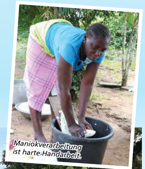
Maniokverarbeitung ist harte Handarbeit.

Ruud Gullit, Patrick Kluivert, Frank Rijkaard – Namen, die nicht nur Fußball-Fans bestens geläufig sind. Alle drei waren Weltklasse, spielten für die Niederlande, haben ihre familiären Wurzeln aber in Surinam. Andere, wie Clarence Seedorf oder Edgar Davids, sind sogar in dem südamerikanischen Land geboren. Doch Surinam, das bis 1975 eine niederländische Kolonie war, ist mehr als nur Fußball. Zum Großteil von tropischem Regenwald bedeckt, verfügt es über eine große Zahl exotischer Pflanzen und Tierarten, wird immer mehr zum spannenden Reiseland.