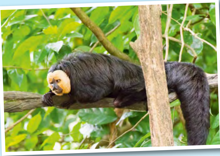
Der Weißkopfsaki (li.) und die Totenkopffäffchen bewohnen die Bäume des Dschungels in Surinam.