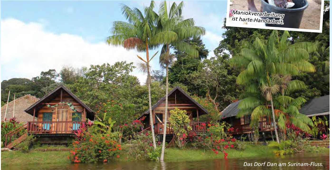
Das Dorf Dan am Surinam-Fluss.