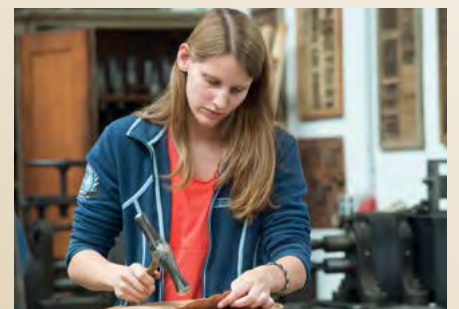
Handarbeit ist Trumpf: Die Bremer Silberwarenmanufaktur Koch & Bergfeld betreut viele wertvolle Trophäen.