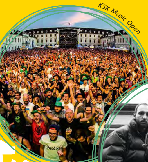
KSK Music Open