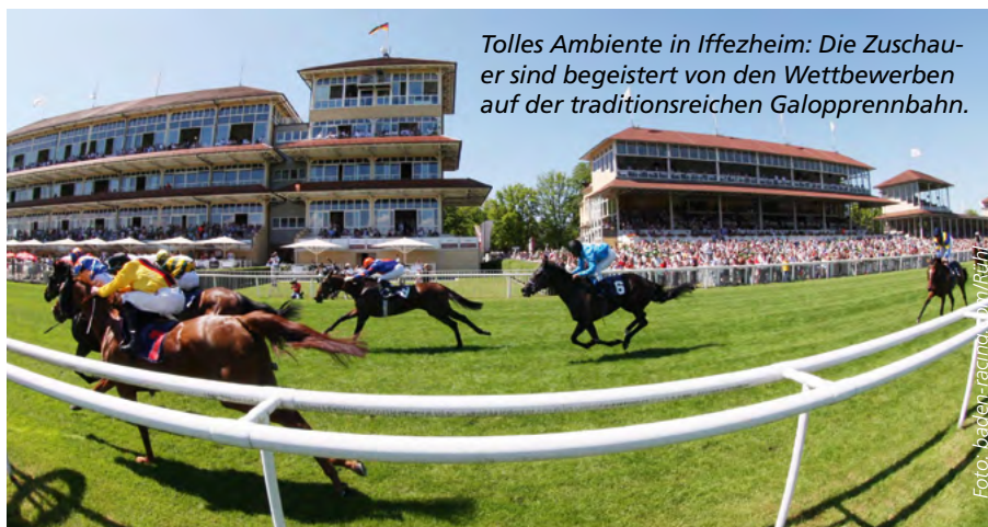
Tolles Ambiente in Iffezheim: Die Zuschauer sind begeistert von den Wettbewerben auf der traditionsreichen Galopprennbahn.

T raditionell wird bei allen drei Ereignissen ein von Lotto Baden-Württemberg gesponsertes Rennen gestartet. Beim Frühjahrs-Meeting ist dies der „Eurojackpot-Preis“ am Donnerstag, 31. Mai (Fronleichnam). Dieser Feiertag wird zum Familientag. Neben vielen Aktionen für Groß und Klein wird auch