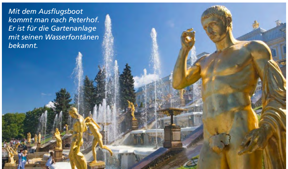
Mit dem Ausflugsboot kommt man nach Peterhof. Er ist für die Gartenanlage mit seinen Wasserfontänen bekannt.

Info: Die Buchung einer Russlandreise ist bei einem Spezialisten zu empfehlen, der Erfahrung mit den Visa- und Einreisebestimmungen hat, zum Beispiel Studiosus oder Lernidee Reisen.