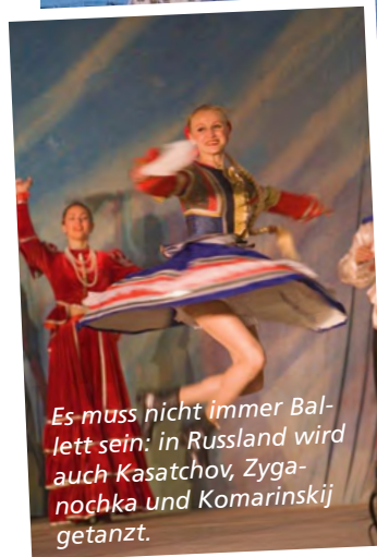
Es muss nicht immer Ballett sein: in Russland wird auch Kasatchov, Zyganochka und Komarinskij getanzt.