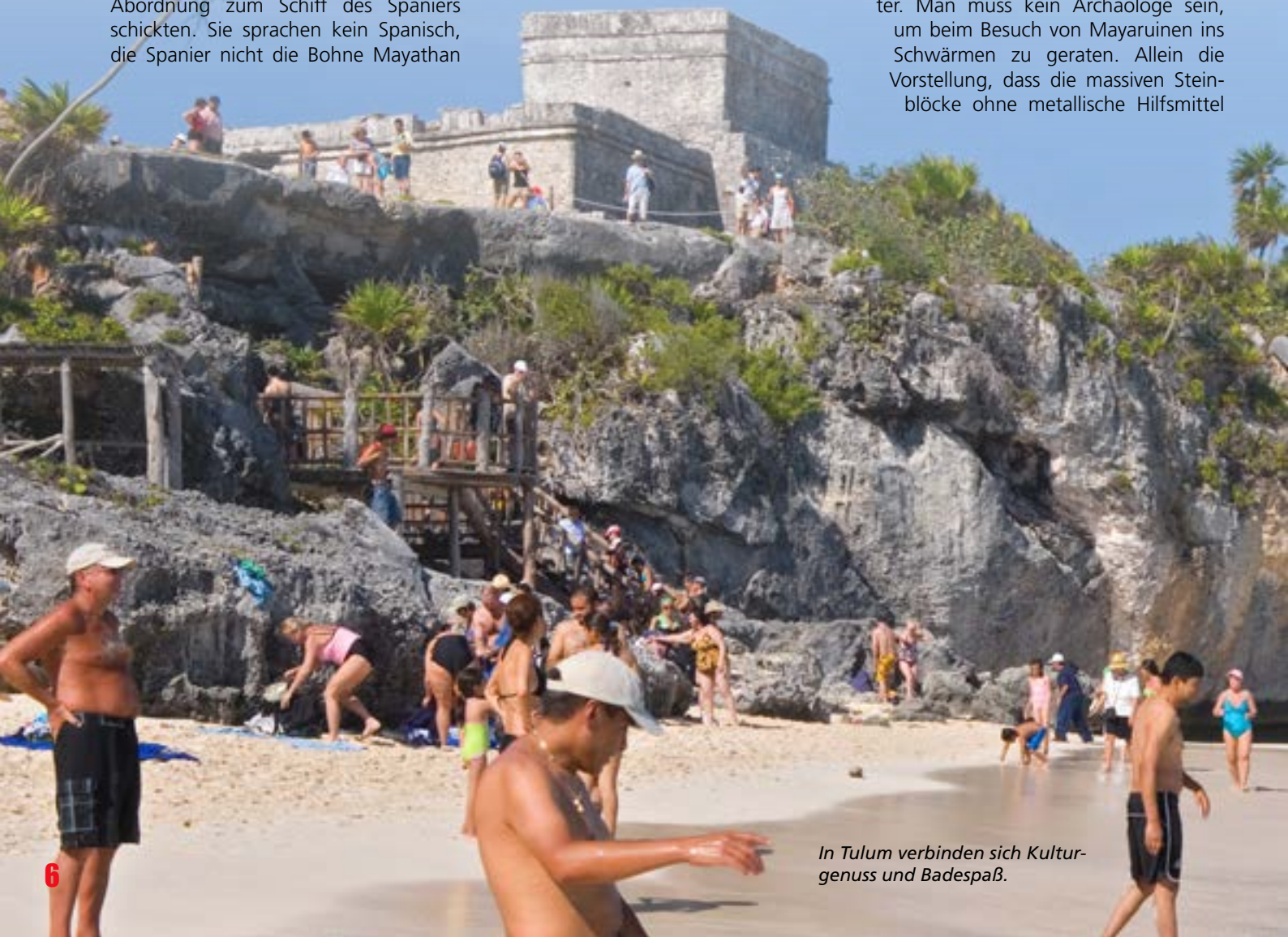
In Tulum verbinden sich Kulturgenuß und Badespaß.

Nach Cobá sind es nur wenige Kilometer. Man muss kein Archäologe sein, um beim Besuch von Mayaruinen ins Schwärmen zu geraten. Allein die Vorstellung, dass die massiven Steinblöcke ohne metallische Hilfsmittel