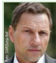
Richy Müller Kommissar im Stuttgartert "Tatort" (ARD/SWR) tippt:

* = Ergebnis stand erst nach Druck dieser Ausgabe fest. E = Ersatzauslosung