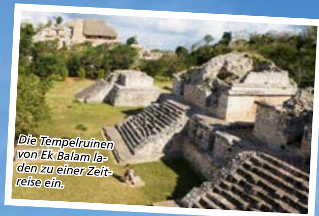
Die Tempelruinen von Ek Balam laden zu einer Zeitreise ein.

Die Halbinsel Yucatán an der Karibikküste Mexikos macht tropische Urlaubsträume wahr und bietet Kultur und Natur.