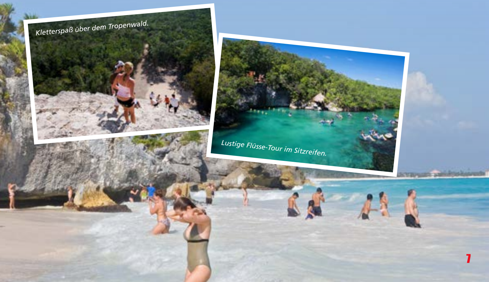
Lustige Flüsse-Tour im Sitzreifen.