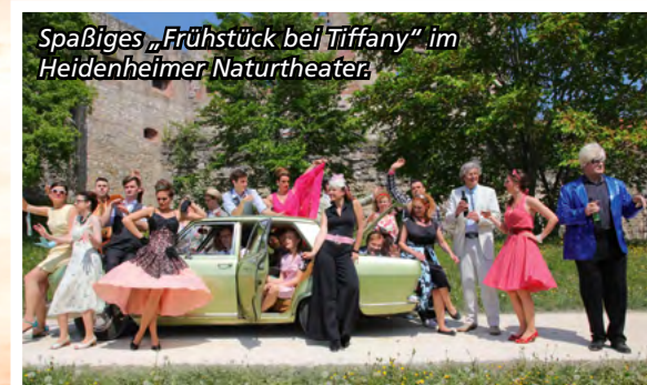
Spaßiges „Frühstück bei Tiffany“ im Heidenheimer Naturtheater.

Keine Irrfahrt, sondern stets ein lohnendes Ziel sind die Besuche der Freilichtbühnen. Auf der Homepage des bundesweiten Verbandes sind alle deutschen Spielstätten, Spielpläne und Termine aufgelistet. www.freilichtbuehnen.de