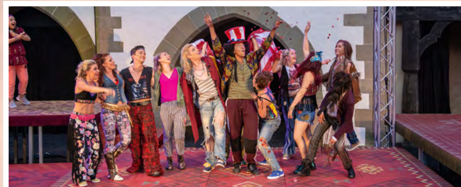
Partystimmung herrscht beim Musical „Hair“ im Burghof von Jagsthausen.

das „Frühstück bei Tiffany“ genießen, beim Kinderstück „Der Prinz und der Bettelknabe“ entspannen oder sich am 5. Juli bei der von Lotto Baden-Württemberg gesponserten „Kleinkunst Benefiz-Gala“ amüsieren. www.naturtheater.de