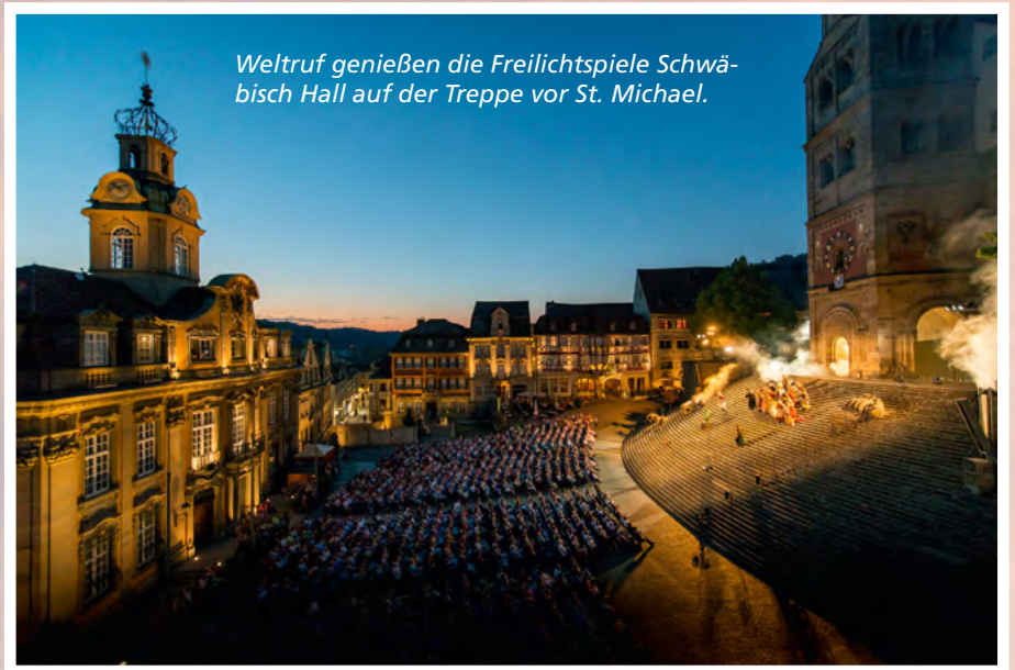
Weltruf genießen die Freilichtspiele Schwäbisch Hall auf der Treppe vor St. Michael.

D as ganze Dorf spielt mit! Ötigheim im Kreis Rastatt zählt zwar nur rund 4400 Einwohner, doch ein großer Teil davon engagiert sich alljährlich bei den Volksschauspielen. Bis zu 600 Personen sind auf, vor und hinter der Bühne im Einsatz. Mit Platz für 4000 Besucher ist die Ötigheimer Naturbühne die größte in Deutschland. Jährlich besuchen rund 100.000 Menschen die