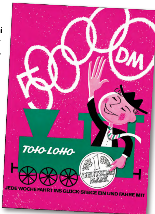
Eine Lokomotive schmückt dieses historische Werbeplakat. Ein Freiburger machte die Fahrt ins Glück mit. Er erzielte 1958 mit den Wagennummern eines Personenzugs den ersten Sechser im Südwesten und gewann 500.000 DM.

Der „Sportbericht“, bei dessen Erscheinen sich sonntagabends an den Bahnhofskiosken lange Schlangen bildeten, berichtete damals unter der Überschrift „Freiburger gewinnt 500.000 DM“: „Sein Gewinnrezept ist so verblüffend einfach wie originell. Während einer Pfingstpartie musste der 28-jährige Angestellte mit seinem Motorroller an einer Bahnschranke warten und merkte sich – zunächst mehr aus Langeweile – die ersten zwei Stellen von den sechs Wagennummern eines vorüberfahrenden Personenzuges, die er einer späteren Eingebung folgend, bei einer Rast auf einen Bierdeckel notierte und daheim auf einen Lottoschein übertrug.“