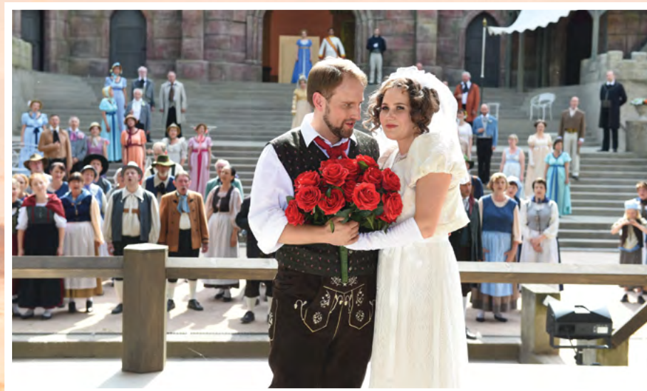
Traumhochzeit beim „Vogelhändler“ in Ötigheim mit 4000 Gästen.

Vampirismus auch auf der Naturbühne „Steintäle“ bei Fridingen im Oberen Donautal: Im Gegensatz zu Dracula steht dort aber mit Winnie Wackelzahn ein absoluter Kinderliebhaber auf der Bühne. Von