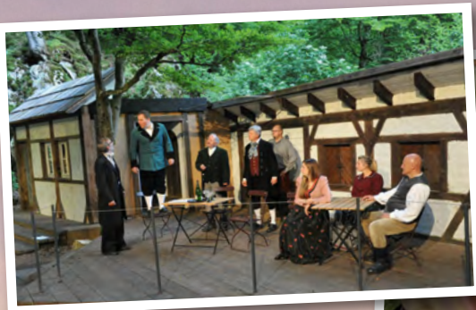
Populäre Stücke: „Das kalte Herz“ im Fridinger „Steintäle“ (oben) und „Dracula“ in Breisach (Mitte).