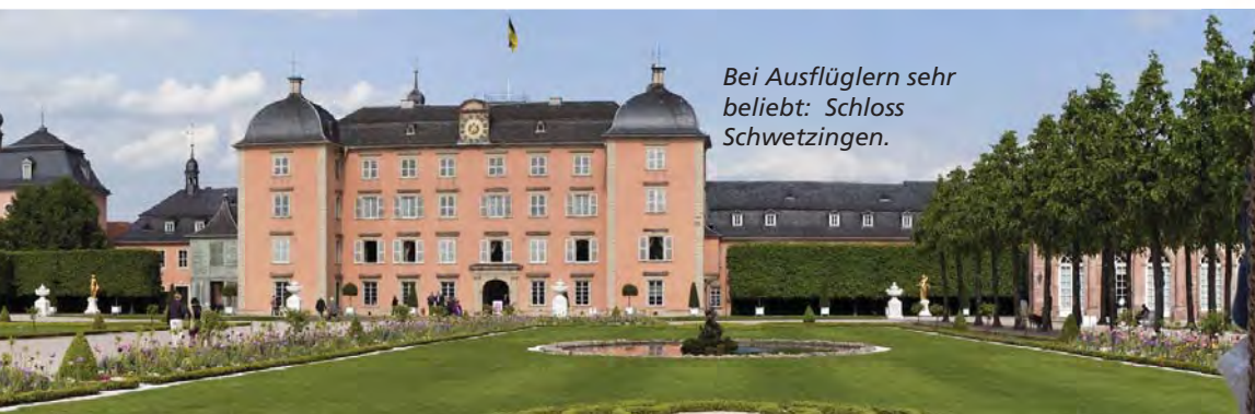
Bei Ausflüglern sehr beliebt: Schloss Schwetzingen.

gene Schieferdach des Gartenpavillons verleiht dem Holzlatzenbau etwas Exotisches und entspricht der damals gängigen Chinamode. „Es ist das einzige Bauwerk des 18. Jahrhunderts in der Kurpfalz, das heute noch von dieser Mode zeugt“, sagte Michael Hörrmann.