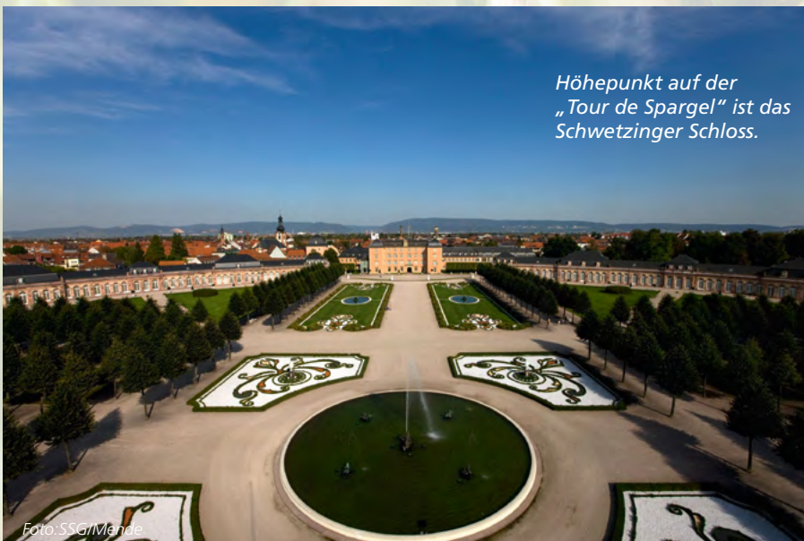
Höhepunkt auf der „Tour de Spargel“ ist das Schwetzingen Schloss.

Bierliebhaber kommen auch am Bodensee auf ihre Kosten. Vorbei an Obst- und Hopfengärten schlängelt sich der Hopfenpfad durch die Landschaft um das oberschwäbische Tett nang. Neben spektakulären Aussichten auf die Montfortstadt und das Alpenpanorama jenseits des Bodensees bietet der für Wanderer und Radfahrer gleichermaßen geeignete Weg Informationen zu Hopfenanbau und Braukunst der Region. Erstmals im Jahr 1150 urkundlich erwähnt, avancierte der Tett nanger Hopfen längst zum Exportschlager. Startpunkt der vier Kilometer langen Tour ist die Kronenbrauerei im Stadtzentrum. Am Ende liegt das Hopfengut N°20, wo sich Hopfenanbau, Braue-