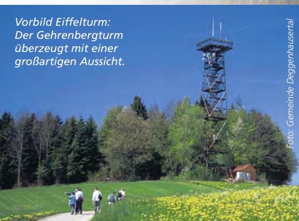
Vorbild Eiffelturm: Der Gehrenbergturm überzeugt mit einer großartigen Aussicht.

Immer wieder für Herzklopfen sorgt auch ein Besuch des Stuttgarter Fernsehturms. Der über 60 Jahre alte und 217 Meter hohe Gigant ist ein echter „All-rounder“: Er bietet einen wunderbaren Ausblick auf die Landeshauptstadt, die Weinberglandschaft des Neckartales, die Schwäbische Alb, den Schwarzwald und den Odenwald. Im Restaurant kann man in 147 Metern Höhe Schlemmen, Tagen und Feiern. Drei Meter höher liegt die Besucherplattform. Kaum zu glauben, bei seinem Bau kostete der Fernsehturm 1954/55 „nur“ 4,2 Millionen Mark.