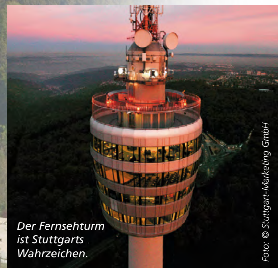
Der Fernsehturm ist Stuttgarts Wahrzeichen.