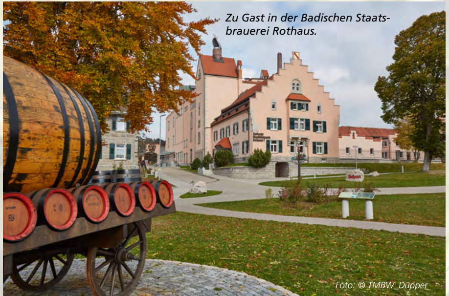
Zu Gast in der Badischen Staatsbrauerei Rothaus.

A uch wenn es die Aussichten in der Ferienregion Sasbachwalden im Schwarzwald eigentlich nicht nötig haben, wirken sie bei einer Wanderung auf einem der örtlichen Schnapsbrunnenwege gleich doppelt so schön. Mit dem Rad oder besser zu Fuß geht es von Brunnen zu Brunnen. Im kalten Bergquellwasser warten regionale Schnäpse, Liköre und Most, aber auch alkoholfreie Erfrischungen auf durstige Aktivurlauber. Entstanden sind sie in den Brennereien und Höfen der Gegend, die schon seit vielen Generationen über Brennrechte verfügen und aus