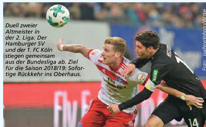
Duell zweier Altmeister in der 2. Liga: Der Hamburger SV und der 1. FC Köln stiegen gemeinsam aus der Bundesliga ab. Ziel für die Saison 2018/19: Sofortige Rückkehr ins Oberhaus.

Rückrunde: 15.-18.03.2019 1. FC Magdeburg SV Darmstadt 98 Erzgebirge Aue 1. FC Union Berlin FC Ingolstadt 04 FC St. Pauli 1. FC Köln Greuther Fürth VfL Bochum Dynamo Dresden Hamburger SV Holstein Kiel 1. FC Heidenheim SC Paderborn 07 SV Sandhausen MSV Duisburg Jahn Regensburg Arminia Bielefeld