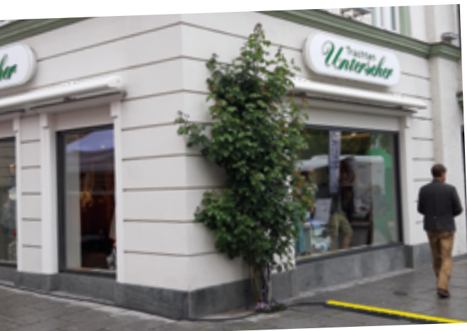
Verwandlung: „Trachten Unterseher“ wird regelmäßig zur Touristinfo.

Vor elf Jahren hat die Touristinfo die Stadtführung „Auf den Spuren der Rosenheim-Cops“ mit ins Programm genommen. Sie ist ein Erfolgsmodell. Besonders aufmerksam werden Cops-Fans, wenn es Neuigkeiten von den Schauspielern gibt. „Der Joseph Hanneschläger war früher ein