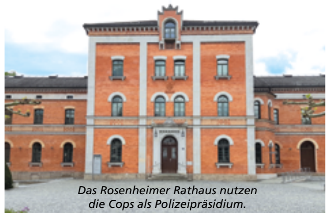
Das Rosenheimer Rathaus nutzen die Cops als Polizeipräsidium.