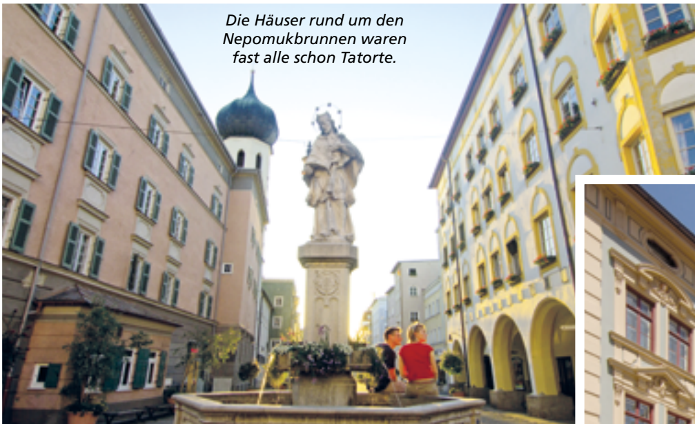
Die Häuser rund um den Nepomukbrunnen waren fast alle schon Tatorte.

Fans wissen: Hier, beim Städtischen Museum, geschah der Rikscha-Mord (Staffel 9, Folge 30).