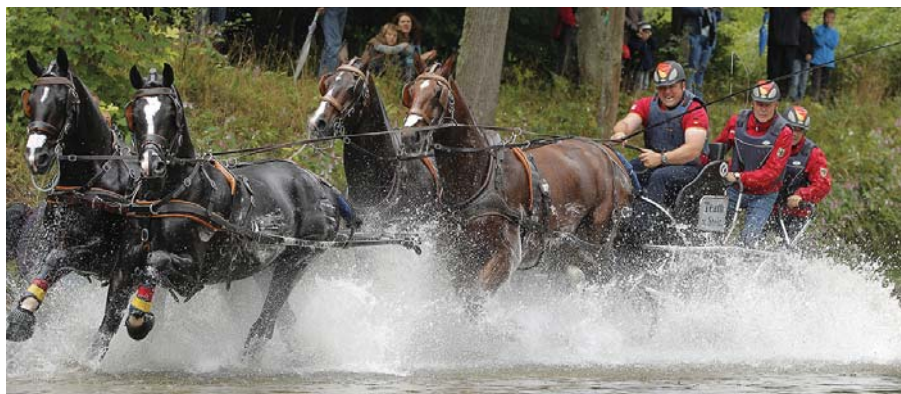
Rasant, spannend, spritzig: Tauchen die Vierspänner in die Brigach ein, freut sich das Publikum – eine der Attraktionen beim CHI in Donaueschingen.

Der Freitag (15.9.) bietet großen Sport im Viereck. Höhepunkt am Abend: das Mannschaftsspringen