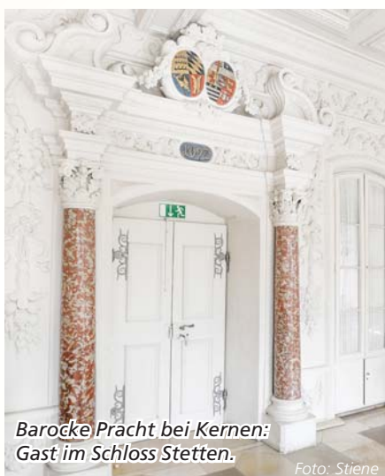
Barocke Pracht bei Kernen: Gast im Schloss Stetten.