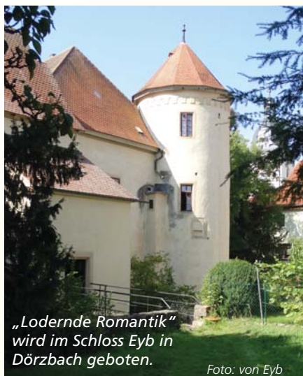
„Lodernde Romantik“ wird im Schloss Eyb in Dörzbach geboten.