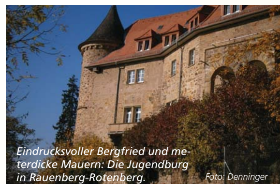
Eindrucksvoller Bergfried und meterdicke Mauern: Die Jugendburg in Rauenberg-Rotenberg.