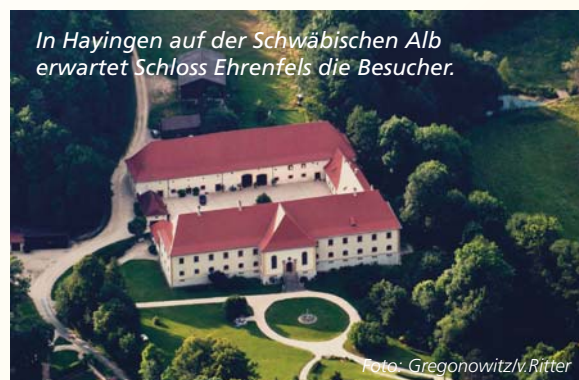
In Hayingen auf der Schwäbischen Alb erwartet Schloss Ehrenfels die Besucher.