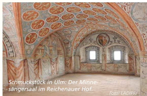
Schmuckstück in Ulm: Der Minnesängersaal im Reichenauer Hof.

Ein Kleinod ist Schloss Eyb, ein im Renaissancestil erbautes ehemaliges Wesserschloss in Dörzbach an der Jagst (Hohenlohekreis). Um 14 Uhr bietet die Familie von Eyb eine Führung an, ab 17 Uhr findet das Konzert „Lodernde Romantik“ statt. Info-Tel. 07937 990033.