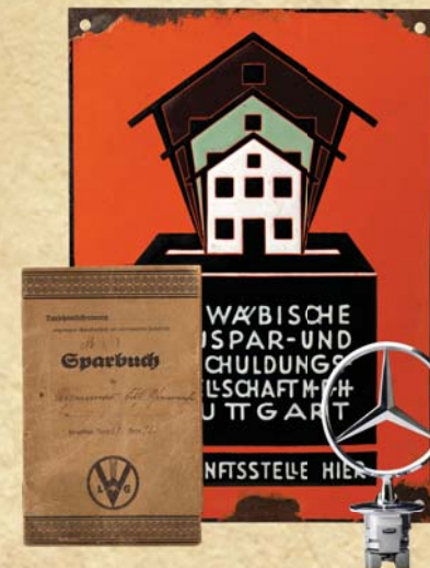
Steff-Bären, Sparbuch und Pustefix sind echt schwäbische Erfindungen.

Der Begriff Schwaben wurzelt im Mittelalter und lässt sich auf die germanischen Sueben zurückführen. Als Bezeichnung eines bedeutenden Herzogtums blieb er nach dem Untergang der Staufer an Südwestdeutschland haften. Im 19. Jahr-