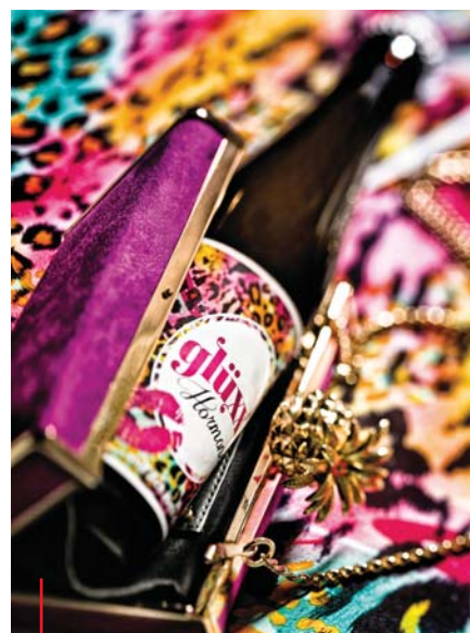
Betont feminin: Die Flasche schmückt sich mit einem aufgedruckten Kussmund und pinkbuntem Leopardendesign.

glüxx-Hormone, alm-Bräu, craft-Saft: Für jeden Geschmack gibt es den passenden Durstlöcher.