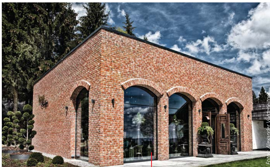
Braukunst für die Dame: In der Brau-Boutique wird beim Bier nichts dem Zufall überlassen.

M änner lieben Bier, manche Frauen auch. „Nur 20 Prozent der Damen weltweit trinken es gern“, und das stieß den Machern der Brau-Boutique in St. Stefan am Walde sauer auf. Das Unternehmen begab sich auf die Suche nach dem weiblichen Bier-Glück. Das Ergebnis: Den Damen mangelte es beim traditionellen Hopfentrunk an der fruchtigen Note und an Abwechslung.