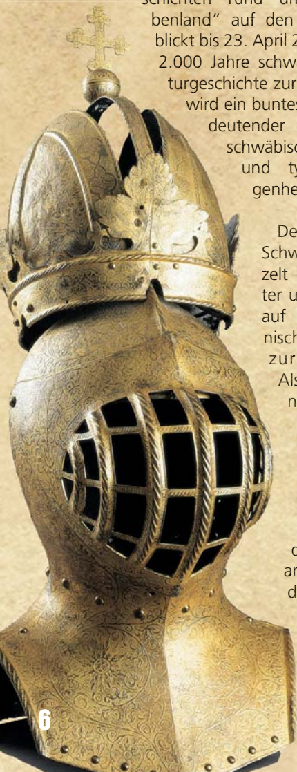
Der Funeralhelm Kaiser Karls V.

...außer Hochdeutsch!“ Der Dialekt ist das schwäbische Erkennungsmerkmal schlechthin. Wenige Kilometer reichen oftmals aus, um in völlig andere (Sprach-)Sphären einzutauchen. Neben dem Badischen wird in Baden-Württemberg unter anderem Schwäbisch gschwätzt. Aber: Ob Schwarzwald, Neckarland, Alb, Oberschwaben oder Allgäu – Mundarten und Aussprache sind oft völlig verschieden. Diese Besonderheiten greift auch die Große Landesausstellung auf. Getreu dem Motto „Mir kennet alles, außer Hochdeutsch“