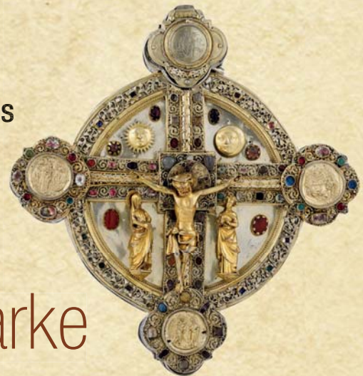
Scheibenkreuz aus dem Villingen Münster.

„Schaffa, schaffa, Häusle baa“: Fleiß, Sparsamkeit, Ordnungsliebe – der Südwesten muss mit vielen Klischees klarkommen. Die große Landesausstellung „Die Schwaben. Zwischen Mythos und Marke“, nimmt im Landesmuseum