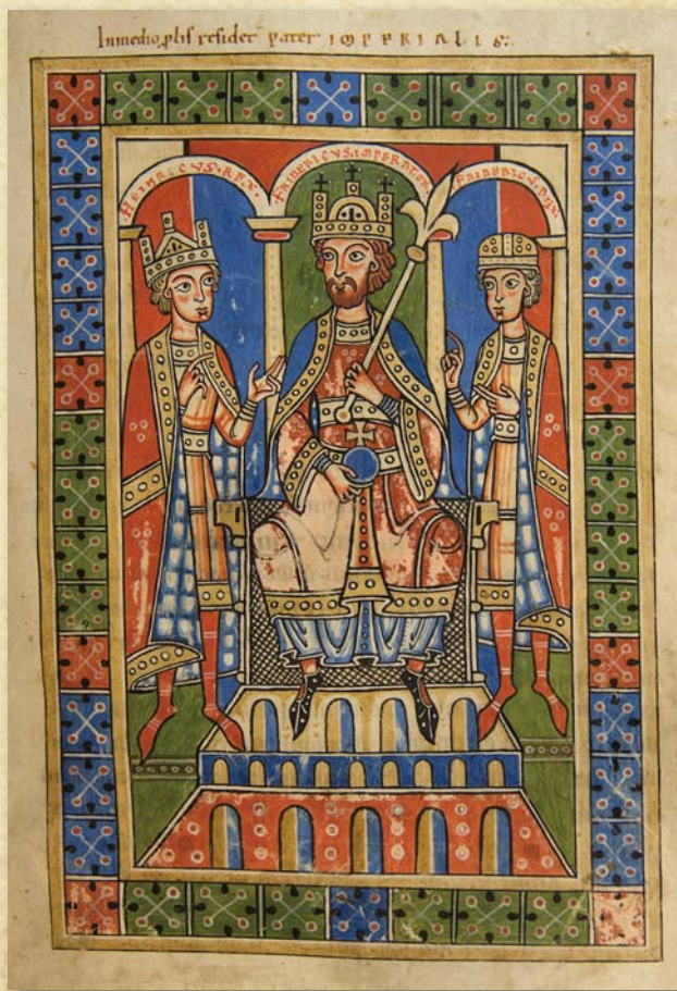
Die Welfenchronik von Weingarten: Kaiser Barbarossa und seine Söhne.