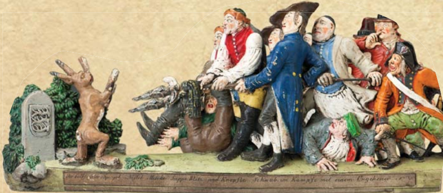
Berühmt und berüchtigt: Die sieben Schwaben.

werden die Führungen im Württembergischen Landesmuseum stilecht auf Schwäbisch angeboten. In seiner gewohnt schwäbisch-charmanten Art führt Dominik Kuhn alias „Dodokay“ durch die Schau.