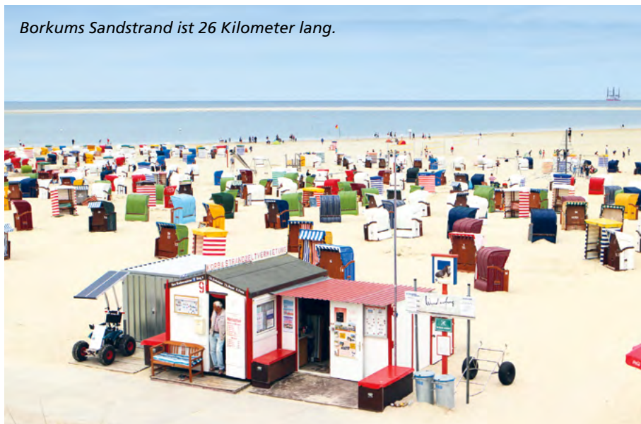
Borkums Sandstrand ist 26 Kilometer lang.