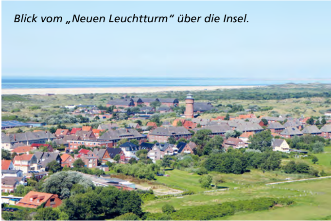
Blick vom „Neuen Leuchtturm“ über die Insel.