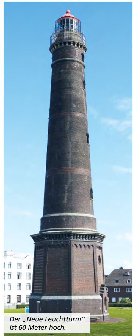
Der „Neue Leuchtturm“ ist 60 Meter hoch.