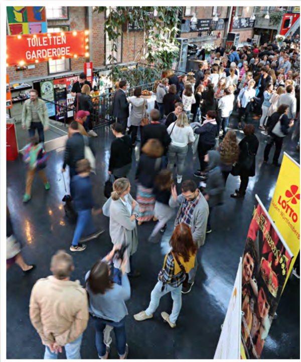
Das Publikum strömte und war begeistert! 900 Zuschauer verfolgten die mehr als zweistündige Bühnenshow.