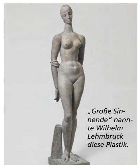
„Große Sinnende“ nannte Wilhelm Lehmbruck diese Plastik.

Begleitend zu den Plastiken lädt im Graphik-Kabinett die Ausstellung „Die Bedeutung der Linie“ zum Staunen ein. Lehmbruck nutzte Zeichnungen, Gemälde und Druckgraphiken als eigenständiges Medium. Berühmt sind seine ausdrucksstarken Radierungen, mit denen er unterschiedliche Facetten menschlicher Emotionen zeigt.