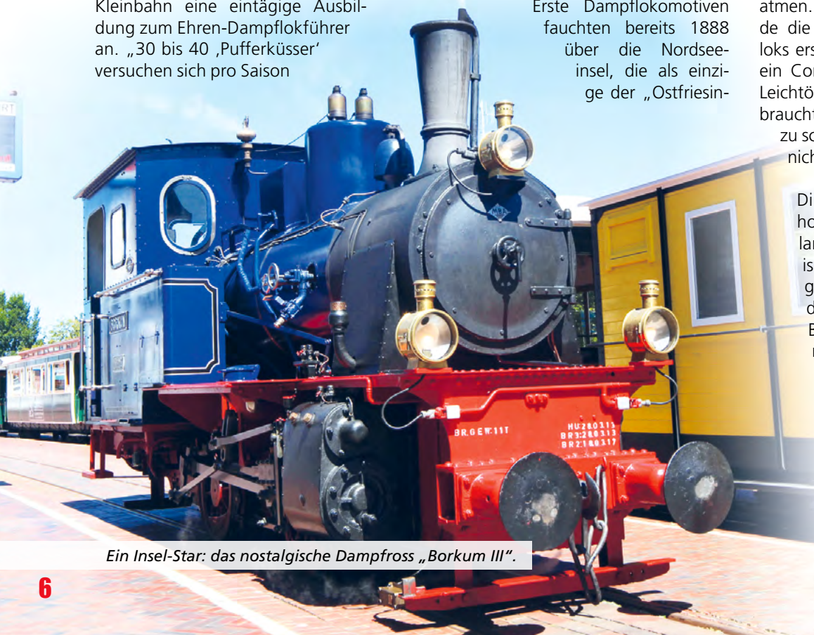
Ein Insel-Star: das nostalgische Dampfross „Borkum III“.

Direkt hinter dem Borkumer Bahnhof steht das Wahrzeichen des Eilands. Der „Neue Leuchtturm“ ist schon seit 1879 ein wichtiges Seefeuer für die Emsmündung und die Umschiffung der Borkumriffplatte. Um das Baumaterial für den Koloss heranzuschaffen, konzipierte man für kurze Zeit eine Pferdebahn. Auf einem Teilstück der Trasse rollt noch heute die Kleinbahn. Von der Aussichtsplattform des Turms sind nicht nur die weite Dünenlandschaft und der 26 Kilometer lange helle, weiche Sandstrand zu erken-