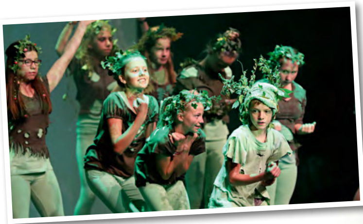
Mit großer Leidenschaft brachten die Darsteller und Sänger der Musikschule Ehingen (Donau) ihr selbstgeschriebenes Stück „Im Land der Wawumoasts - aus Fremden werden Freunde“ auf die Bühne.