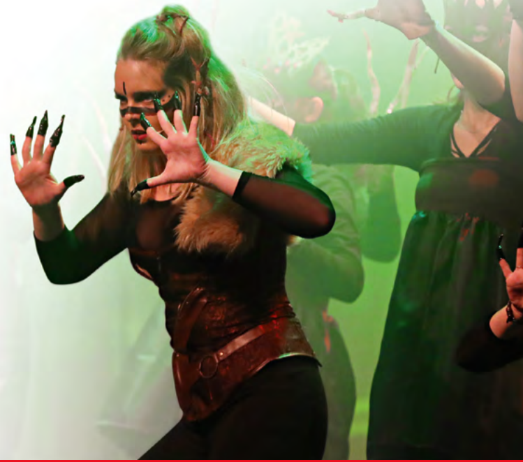
Professionell bis in die Fingerspitzen. Für die Musical-Ausschnitte der Preisträger gab's Jubelstürme der Kinder und Jugendlichen.