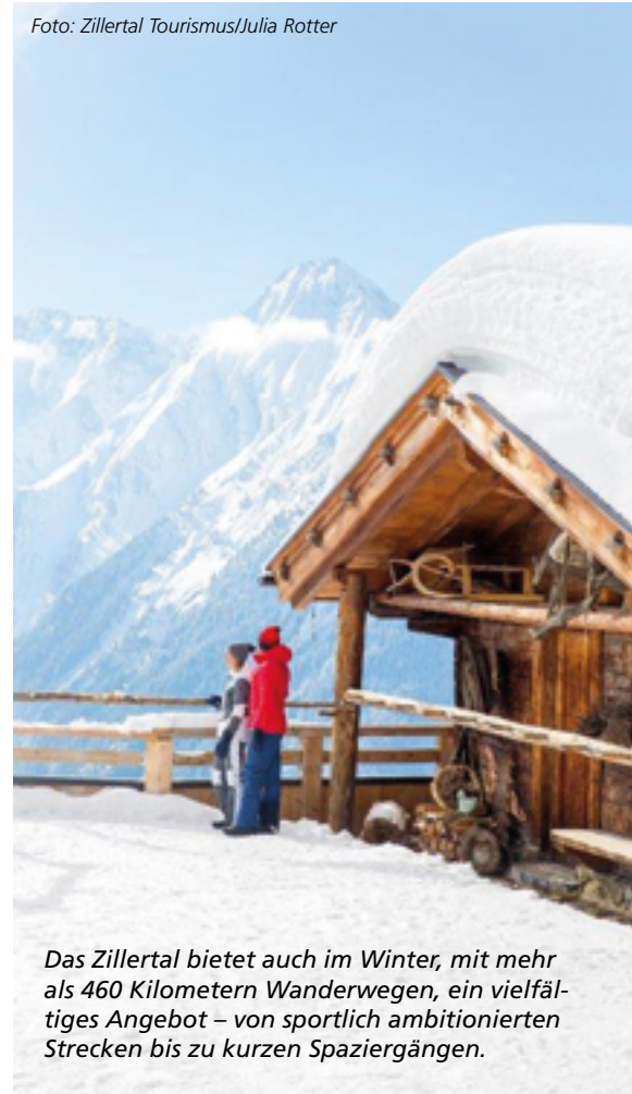
Das Zillertal bietet auch im Winter, mit mehr als 460 Kilometern Wanderwegen, ein vielfältiges Angebot – von sportlich ambitionierten Strecken bis zu kurzen Spaziergängen.

nessangebote, Museen und Schau-Senneerien. glüXmagazin-Tipp: So richtig „runterkommen“ kann man bei einer Pferdeschlittenfahrt ins Schönachtal bei Gerlos oder beim Brotbacken im Zillergrund.