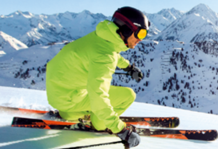
Das Skigebiet zwischen Fügen und Hintertux zählt zu einer der führenden Wintersportregionen in den Alpen.

Jeder Skifahrer träumt von jungfräulichen Pisten. Beim Good Morning Skiing in der Zillertal Arena sind sie zu finden. Ab 6:55 Uhr setzen sich an ausgewählten Terminen in Zell, Gerlos und Königseilen die Bergbahnen mit den Brettli-Fans in Bewegung. Nach den ersten Abfahrten sorgt ein Bergfrühstück auf der Schmankerlhütte Kreuzwiesenalm für Energienachschub. Die ideale Basis für