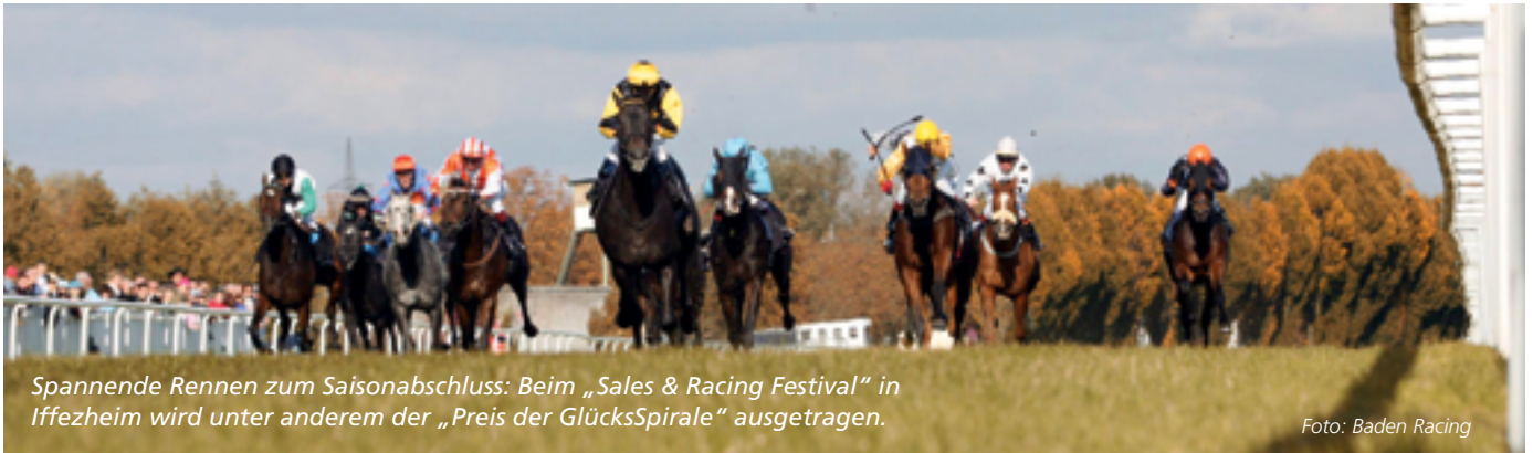
Spannende Rennen zum Saisonabschluss: Beim „Sales & Racing Festival“ in Iffezheim wird unter anderem der „Preis der GlücksSpirale“ ausgetragen.