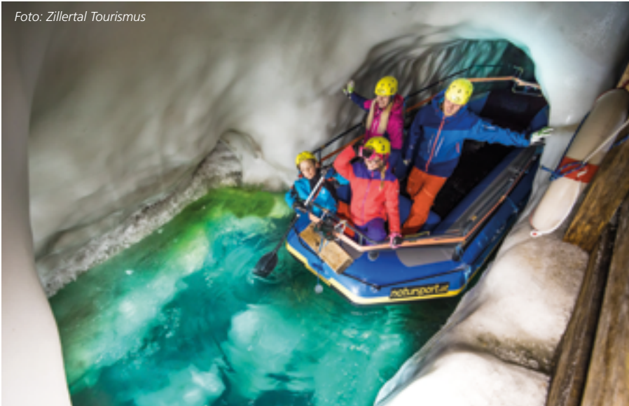
Der Natur Eis Palast am Hintertuxer Gletscher ist ein weltweit einzigartiges Naturjuwel, das ganzjährig erkundet werden kann – nicht nur zu Fuß.

die herrliche Skirunde über Gerlos ins Salzburger Land nach Krimml.