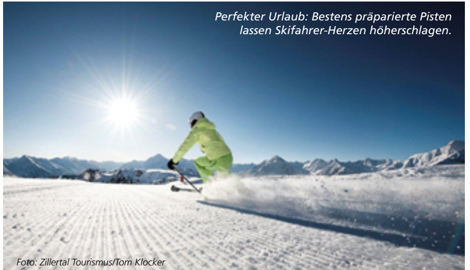
Perfekter Urlaub: Bestens präparierte Pisten lassen Skifahrer-Hezen höherschlagen.

Wer es weniger rasant mag, kann mit den Langlaufplatten auf 125 Loipenkilometern durchs Tal gleiten oder Sonne, frische Luft und Natur auf mehr als 460 Kilometern geräumter Winterwanderwege genießen. Nicht zu vergessen, dass gleich 14 präparierte Rodelbahnen für ein besonderes Vergnügen sorgen.