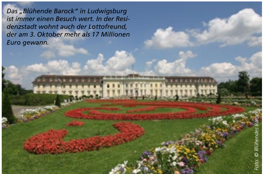
Das „Blühende Barock“ in Ludwigsburg ist immer einen Besuch wert. In der Residenzstadt wohnt auch der Lottofreund, der am 3. Oktober mehr als 17 Millionen Euro gewann.

M it sieben Euro Einsatz war der Kundenkartenspieler aus der Barockstadt bei der Mittwochsziehung vom 3. Oktober mit dabei. Durch das Vollsystem „6 aus 7“ durfte er in einem Feld des Systemscheines sieben statt nur sechs Zahlen ankreuzen. Damit glückte dem Schwaben der Millionengewinn: Unter seinen sieben Glückszahlen waren die sechs Gewinnzahlen (3-9-29-30-33-39), außerdem stimmte auch die Superzahl 9. Damit gewann der Lottofreund mehr als 17,3 Millionen Euro allein in der Klasse 1 (theoret. Chance rund 1 zu 140 Mio.) und räumte dank des Vollsystems auch in der Klasse 3 sechsmal 4703,50 Euro und damit insgesamt weitere 28.221 Euro ab. Den Tipp des Ludwigsburgers sehen Sie unten, die sechs Gewinnzahlen sind eingekreist.