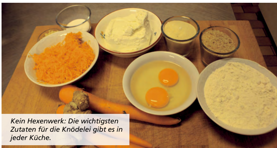
Kein Hexenwerk: Die wichtigsten Zutaten für die Knödelei gibt es in jeder Küche.