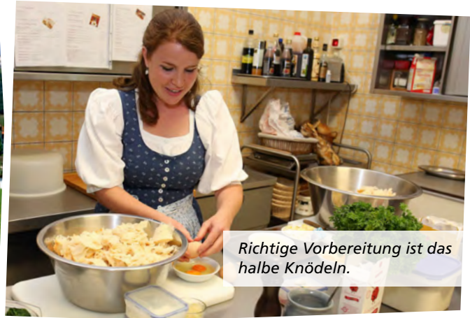
Richtige Vorbereitung ist das halbe Knödeln.

fährt der unerfahrene Knödler, denn dann saugen sich die trockenen Semmelscheiben viel besser voll. Dazu Eier, Salz, Pfeffer, Muskat und Petersilie und schon ist er fertig, der echte Semmelknödel, der perfekt mit deftigem Schweinsbraten oder Rahmschwammerln, also Pilzen, korrespondiert. Doch dann kommt der Geschmack, die Verfeinerung, die hohe Kunst für Knödeltouristen, die erst die ganze Bandbreite des Knödels offenbart.