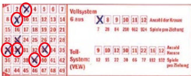
Der Tipp des Ludwigsburgers: Er kreuzte im Systemfeld sieben Zahlen an und markierte im Systembestimmungsfeld das Kästchen für das Vollsystem „6 aus 7“. Die sechs Gewinnzahlen wurden zur besseren Kenntlichmachung eingekreist: 3-9-29-30-33-39. Da außerdem die als Superzahl ausgeloste 9 als letzter Ziffer seiner Losnummer auf der Spielquittung stand, wurde aus den „6 Richtigen“ ein Sechser mit Superzahl.

Die komplette Gewinn Tabelle des Vollsystems „6 aus 7“ ist unten abgedruckt. Die Gewinn tabellen aller anderen Systeme und weitere Informationen zum Systemspiel finden Sie in der Broschüre „System-Infos für Lotto 6aus49 einschließlich System-Anteile“, die es kostenlos in jeder Lotto-Annahmestelle gibt.