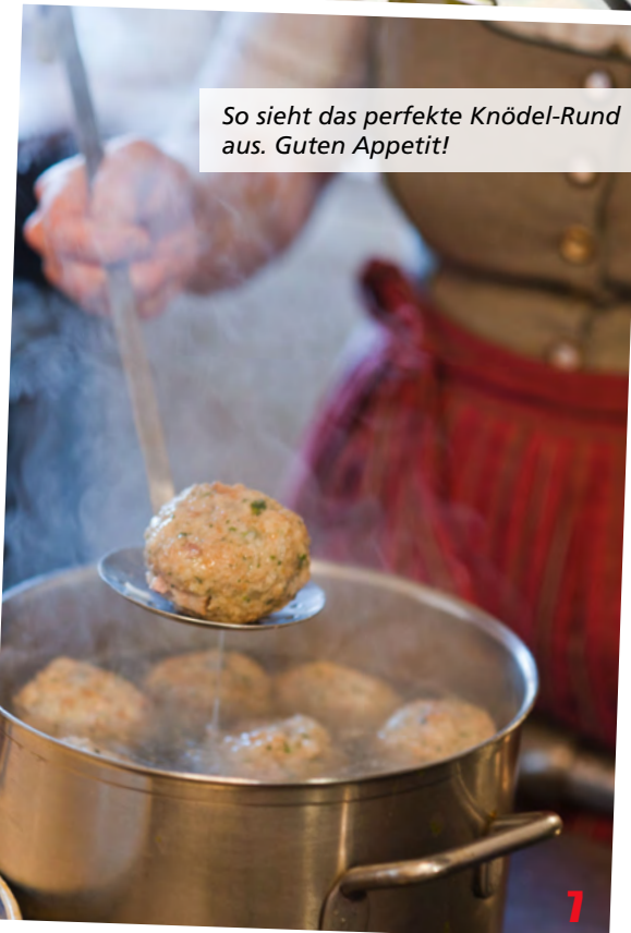
So sieht das perfekte Knödel-Rund aus. Guten Appetit!