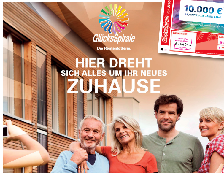
Spielteilnahme ab 18 Jahren. Glücksspiel kann süchtig machen. Nähere Informationen bei LOTTO und unter www.otto-bw.de . Hotline der BZgA: 0800 1 372 700 (kostenlos und anonym).

Erfüllen lassen sich mit den Losen der GlücksSpirale große und kleine Träume: Es gibt sieben Gewinnklassen – von 10 Euro in der Klasse 1 für eine richtige Gewinnzahl (Endziffer der Losnummer) bis zu 2,1 Millionen Euro in der Klasse 7 (theoret. Chance 1 zu 10 Mio.). Glückspilze können sich bei einem Gewinn in Klasse 7 entscheiden, ob sie die gesamte Summe von