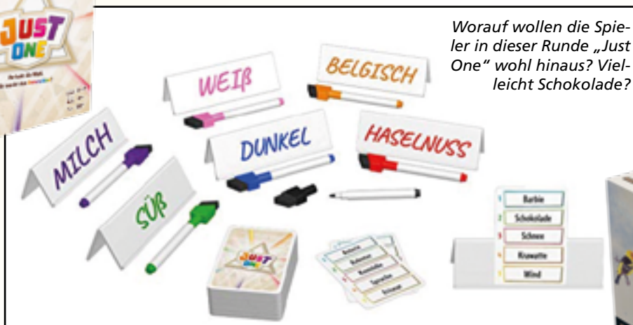
Worauf wollen die Spieler in dieser Runde „Just One“ wohl hinaus? Vielleicht Schokolade?