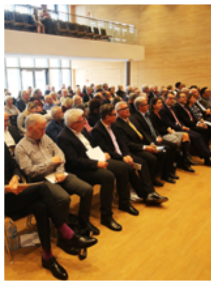
Großes Interesse: Der Preisverleihung wohnten zahlreiche Ehrengäste bei.