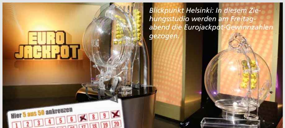
Blickpunkt Helsinki: In diesem Ziehungstudio werden am Freitagabend die Eurojackpot-Gewinnzahlen gezogen.

Besonders interessant an der aktuellen Konstellation: In der Klasse 2 gewinnt man mit fünf Treffern bei „5aus50“ und