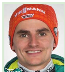
Richard Freitag Skispringer, Weltcup-Zweiter 2017/18, Fan von Erzg. Aue, tippt:

grün = Gewinnspiele 6aus45 Auswahlstipp, * = Zusatzspiel, E = Ersatzauslösung