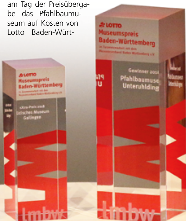
Markant! Diese Ehrenpreise gingen an die beiden ausgezeichneten Museen.

Der Lotto-Museumspreis sei eine „Anerkennung und Wertschätzung für die wertvolle und hochqualifizierte Arbeit“, so Wacker weiter. Das gelte auch für den mit 5000 Euro dotierten diesjähri-