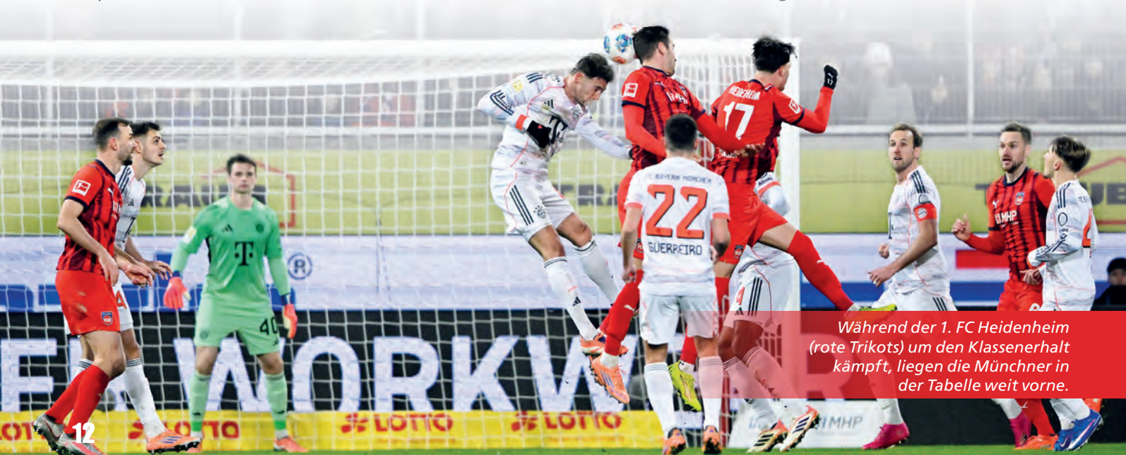
Während der 1. FC Heidenheim (rote Trikots) um den Klassenerhalt kämpft, liegen die Münchner in der Tabelle weit vorne.